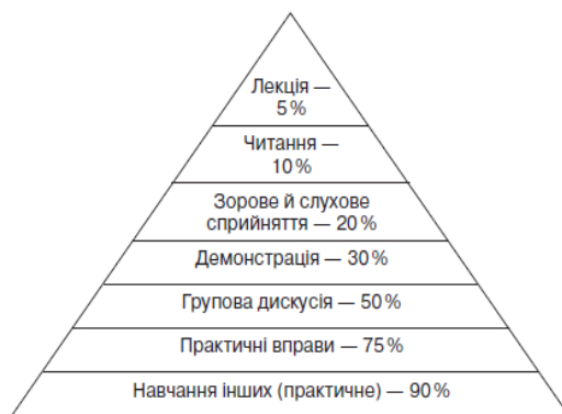
Схема 1. Піраміда навчання

Дослідження проведені Національним тренінговим центром (США, штат Меріленд) у 1980-х роках, показує, що інтерактивне навчання забезпечує краще засвоєння матеріалу, бо впливає не лише на свідомість учня, а й на його почуття, волю. Результати цих досліджень відображено у схемі.